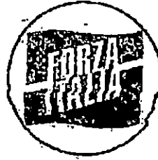
GRUPPO CONSILIARE FORZA ITALIA