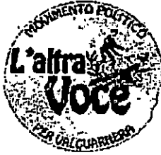
GRUPPO CONSILIARE L'ALTRA VOCE PER VALGUARNERA