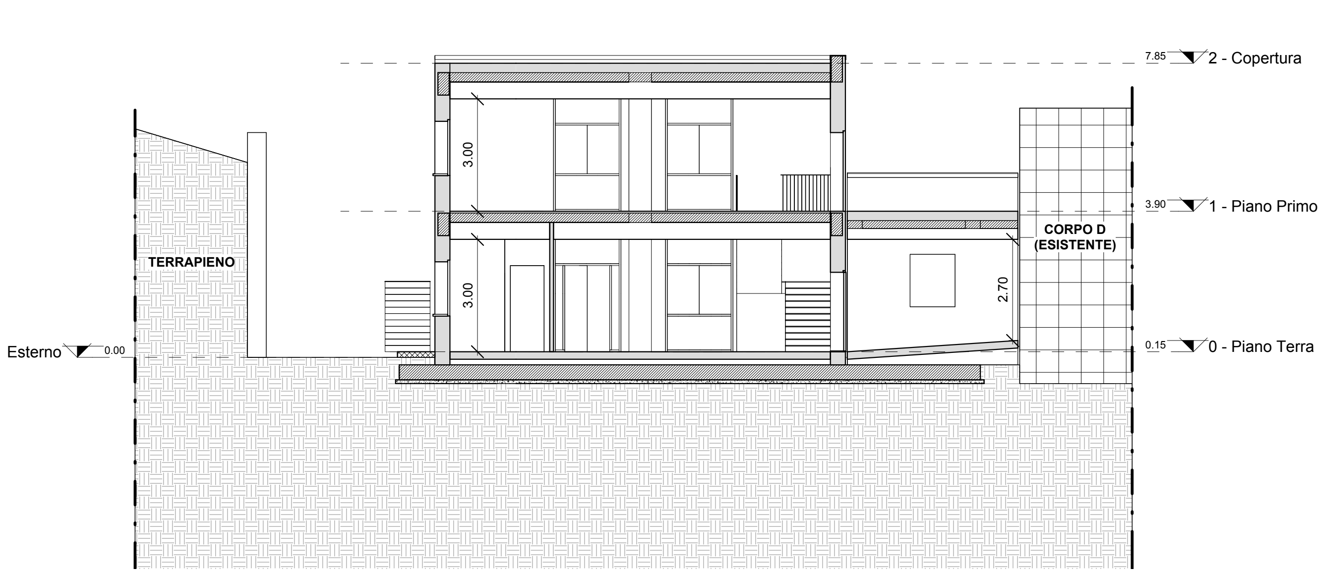
SEZIONE A-A - Scala 1:100